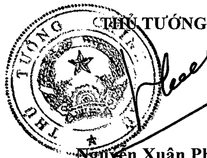
Nguyễn Xuân Phúc

Điều 2. Bãi bỏ Điều 14 và sửa đổi Điều 15 thành Điều 14./.